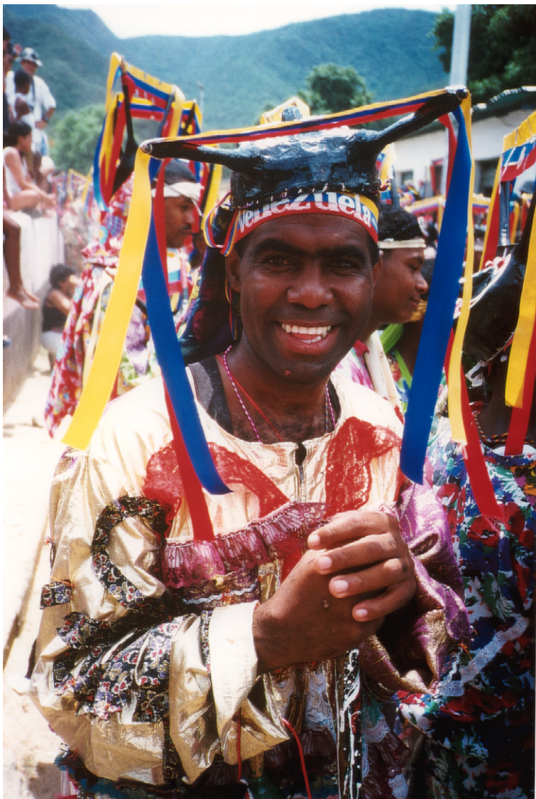
Een van de diablos danzantes , de dansende duivels, die met Corpus Christi het gevecht met Christus aangaan. Gemaakt in Venezuela.