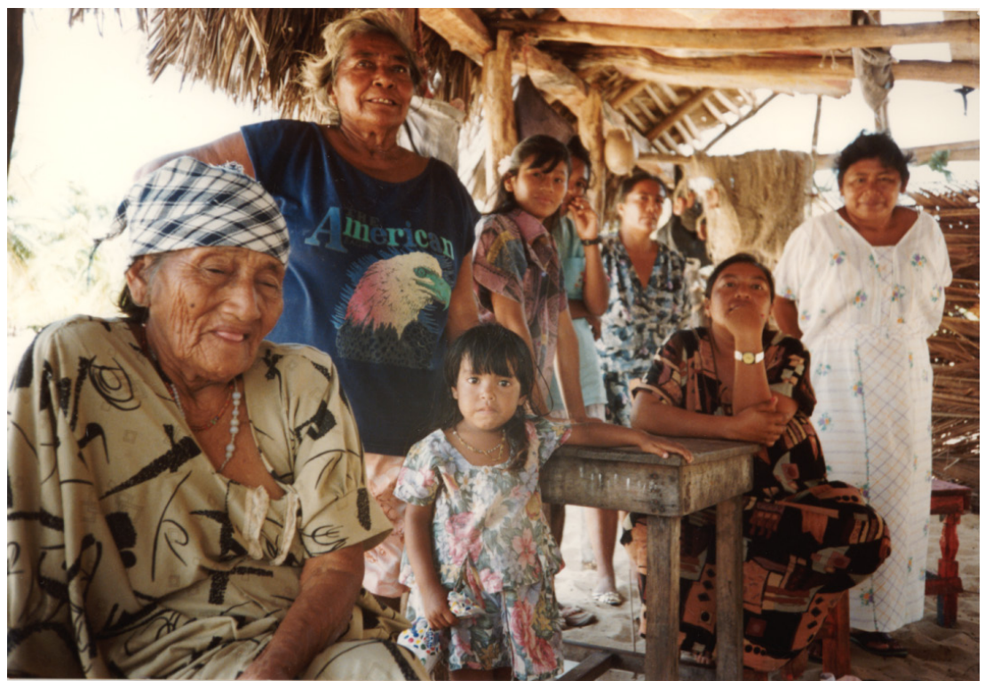
Inheemse vrouwen uit het noordwestelijke puntje van Venezuela.